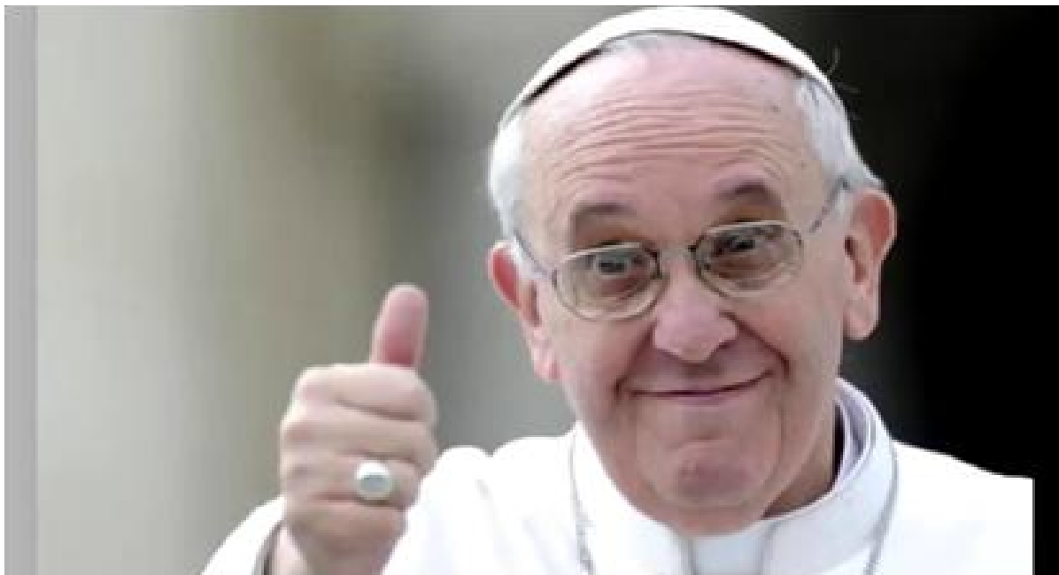
Figura 6 – Deus verdadeiro é relativo e real