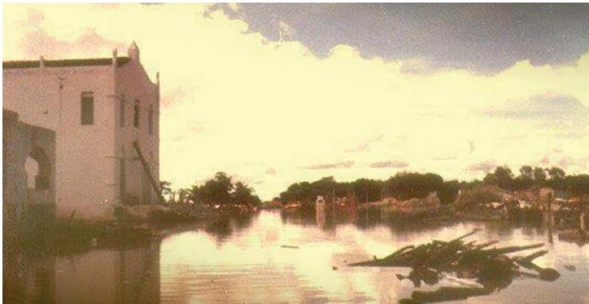
Figura 5 – Igreja São João Batista, dias antes de ser inundada pelo Lago de Itaparica